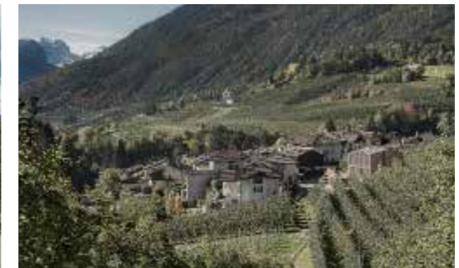
Das Haus steht zwischen Apfelplantagen. | The house is surrounded by apple plantations.

4 Gemeinschaftszentrum | Community Centre, 2015 3. Preis | 3 rd prize, € 10 000 Caltron, I-Cles Bauherrschaft | Principals: Comune di Cles Architektur | Architecture: Mirko Franzoso, I-Cles Baukosten | Building costs: € 0.75 Mio. Energiekennzahl | Energy key: 14.8 kWh/m 2 a