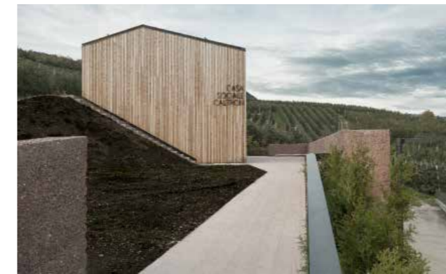
Über dem Sockel ragt ein Holzbau auf. | A timber construction rises above the basement.