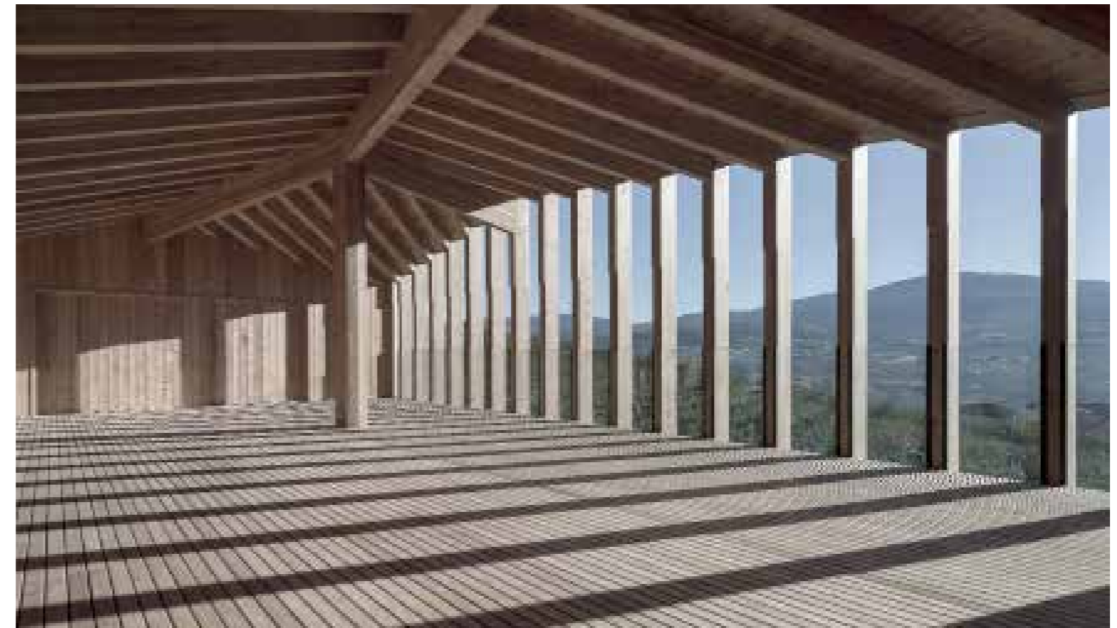
Das unbeheizte Dachgeschoss öffnet sich zur Aussicht. | The unheated attic floor opens towards the view.

4 Gemeinschaftszentrum | Community Centre, 2015 3. Preis | 3 rd prize, € 10 000 Caltron, I-Cles Bauherrschaft | Principals: Comune di Cles Architektur | Architecture: Mirko Franzoso, I-Cles Baukosten | Building costs: € 0.75 Mio. Energiekennzahl | Energy key: 14.8 kWh/m 2 a