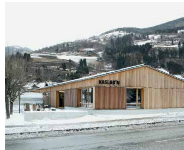
Die grossen Fenster schaffen Öffentlichkeit. | The big windows provide visibility.

25 Schaukäserei Kaslab'n | Show dairy Kaslab'n, 2016 2. Preis | 2 nd prize, € 10 000 Mirnockstrasse 19, A-Radenthein Bauherrschaft | Principals: Genossenschaft Kaslab'n Nockberge, A-Radenthein Architektur | Architecture: Hohengasser Wirnsberger Architekten, A-Spittal an der Drau Statik Massivbau | Structural analysis: Urban & Glatz Ziviltechniker- gesellschaft, A-Spittal an der Drau Statik und Planung Holzbau | Statics and planning timber construction: Tschabitscher, A-Steinfeld Baukosten | Building costs: € 2.1 Mio. Energiekennzahl | Energy key: 58 kWh / m 2 a