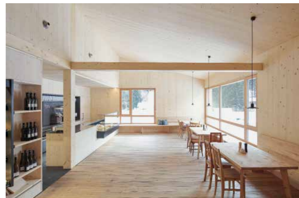
Der Verkaufsraum ist auch Ess- und Aufenthaltszimmer. | The shop is also a room to eat and spend time in.