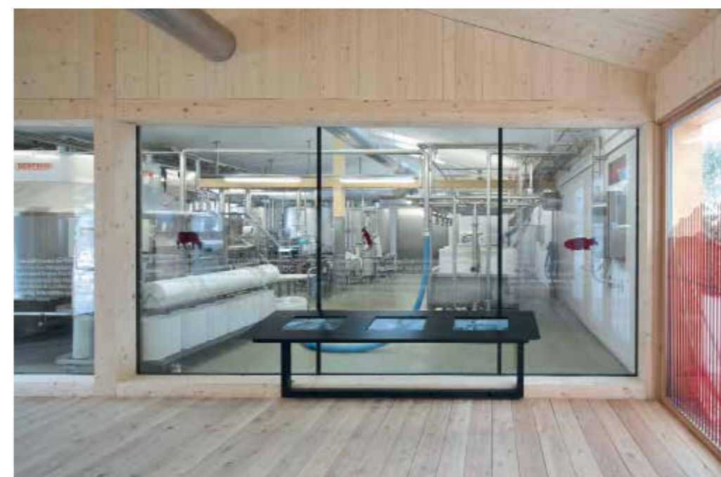
Besucher erhalten Einblick in die Käseproduktion. | Visitors gain insight into cheese production.