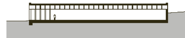
Längsschnitt | Section

This is Lechner's third Mpreis market, but the first of them that was entirely newly built. "The building was meant to have a strong character expressed in its structure and materials, but its volume should not impose on the neighbouring buildings." The impossible was achieved by means of a concentrated interplay of tectonics. The timber construction protrudes from the façade giving it a powerfully rhythmic depth. On the inside, the market seems light and bigger than imagined. The roof rests on well sized glued laminated timber beams, the light band in between allows a view from the spice rack onto the peaks of the Tennen Mountains. By now it must be clear: This is a building that could and would not be anywhere else. ●