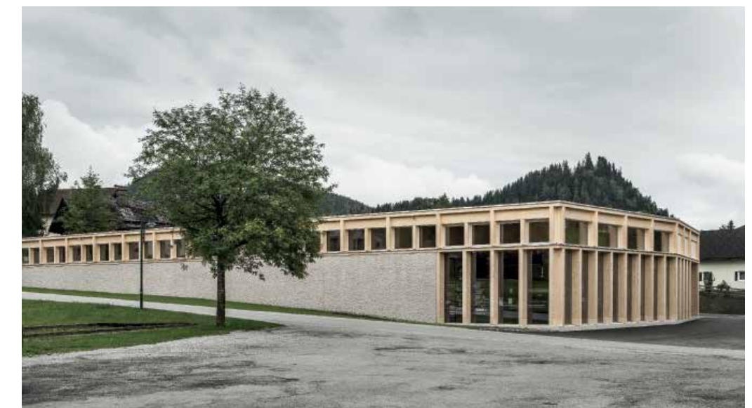
Subtil in den Hang eingefügt. | Discreetly set into the slope.

24 Mpreis Supermarkt | Mpreis supermarket, 2016 2. Preis | 2 nd prize, € 10 000 Dorfstrasse 25, A-St. Martin am Tennengebirge Bauherrschaft | Principals: Mpreis Warenvertriebs GmbH, A-Völs Architektur | Architecture: LP architektur, A-Altenmarkt im Pongau Statik | Structural analysis: Alfred Brunnstainer, A-Natters Bauphysik | Building physics: Fiby, A-Innsbruck Baukosten | Building costs: € 1.4 Mio. Energiekennzahl | Energy key: 41.8 kWh / m 2 a