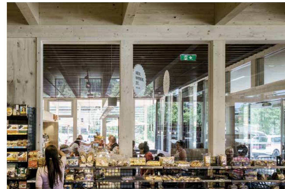
Glas verbindet den Verkaufsraum mit dem Café. | A glass wall connects the shop to the café.

Die Jury meint: «Das Gebäude beweist: Auch gewöhnliche Ladengebäude können aussergewöhnlich gestaltet sein; eine profane Nutzung ist keine Ausrede, die Architektur zu vergessen. Subtil fügt sich der Bau in die Topografie ein, markant wirkt der Spritzbeton, sorgfältig ist die Holzfassade gefügt. Das begrünzte Dach und die Luftwärmepumpe sparen Energie. Die Fenster bringen viel Licht ins Bistro, das zum Treffpunkt wird. So schafft die Architektur einen öffentlichen Ort – mitten im Alltag.»