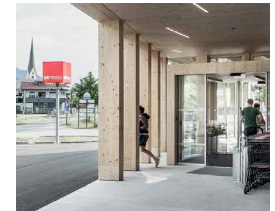
Das Mpreis-Logo verspricht mehr als einen Supermarkt. | The Mpreis logo stands for more than just a supermarket.