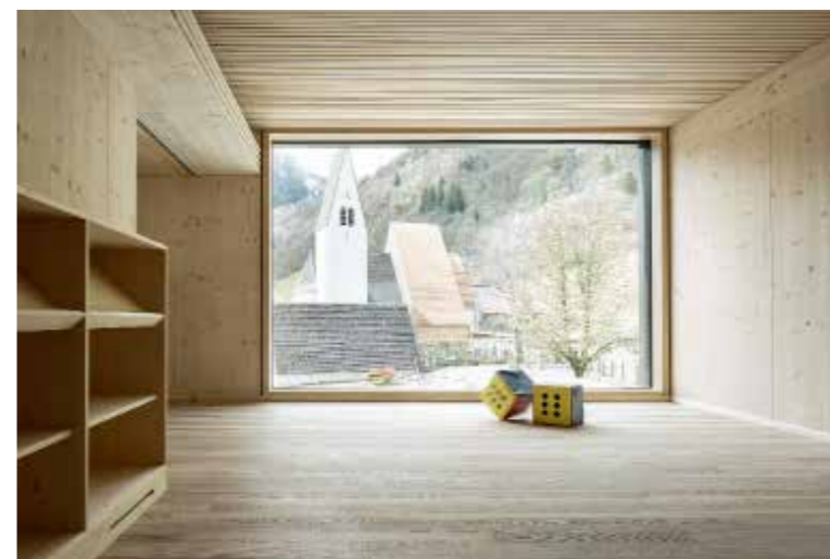
Blick aus dem Gruppenraum auf die Kirche. | View of the church from the group room.