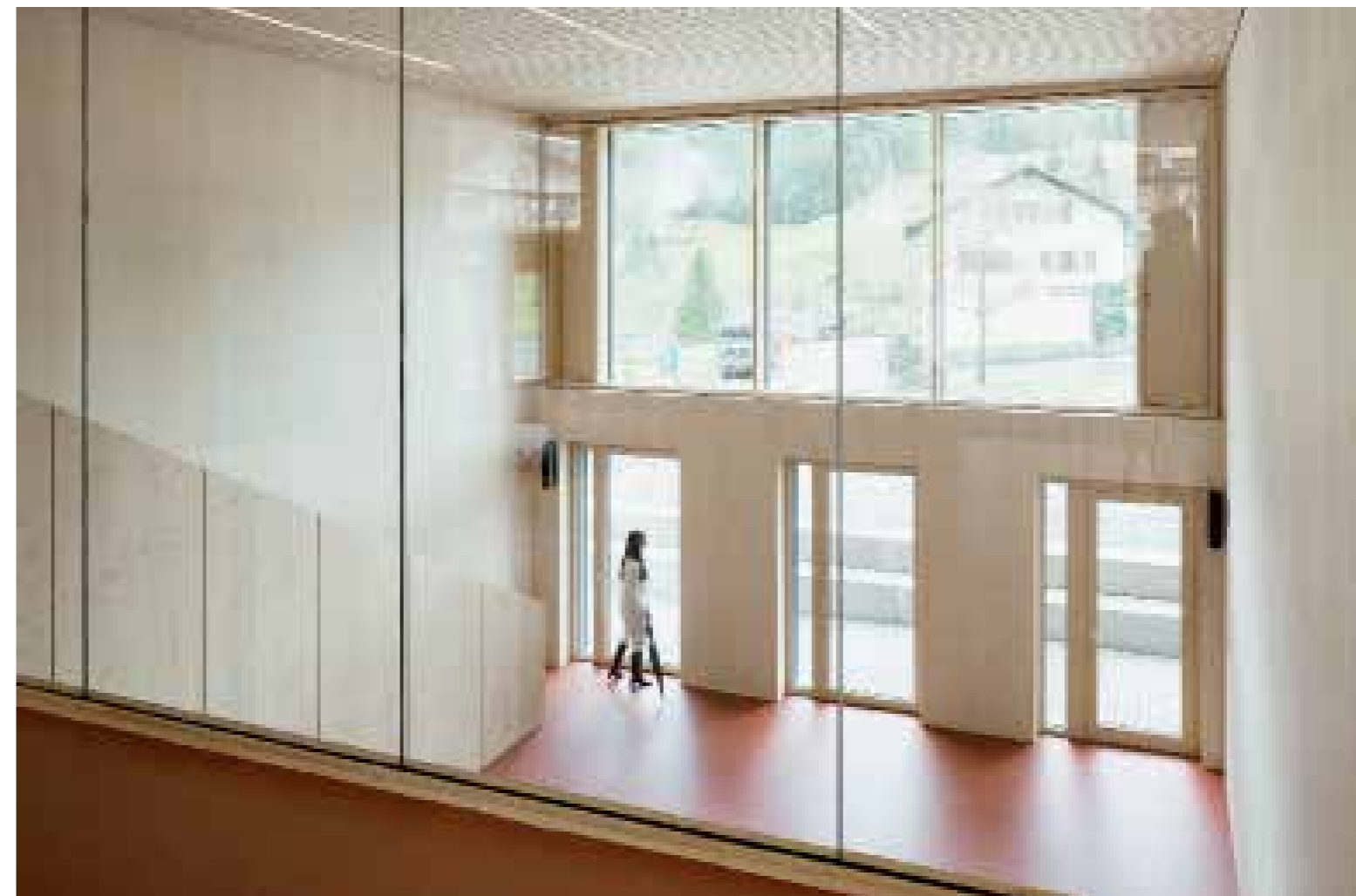
Eine kleine Treppe verbindet den Bewegungsraum mit dem Erdgeschoss. | A small staircase links the physical activity room with the ground floor.

The school is a record building. It was awarded 976 of 1000 possible points in the Municipal Building Pass (Kommunalgebäudeausweis), which evaluates environmental sustainability. No other building in Vorarlberg has ever achieved a higher score. All construction companies involved are based within a 100 km radius, most of them are from Vorarlberg with its strong tradition of craftsmanship. The walls and the ceiling are insulated with sheep wool and cellulose. An earth probe supplies heat, the municipal photovoltaic system provides part of the electricity. "The building stimulates a change of perception in the area", Zottele says. "It proves that comprehensive sustainability is possible and affordable." ●