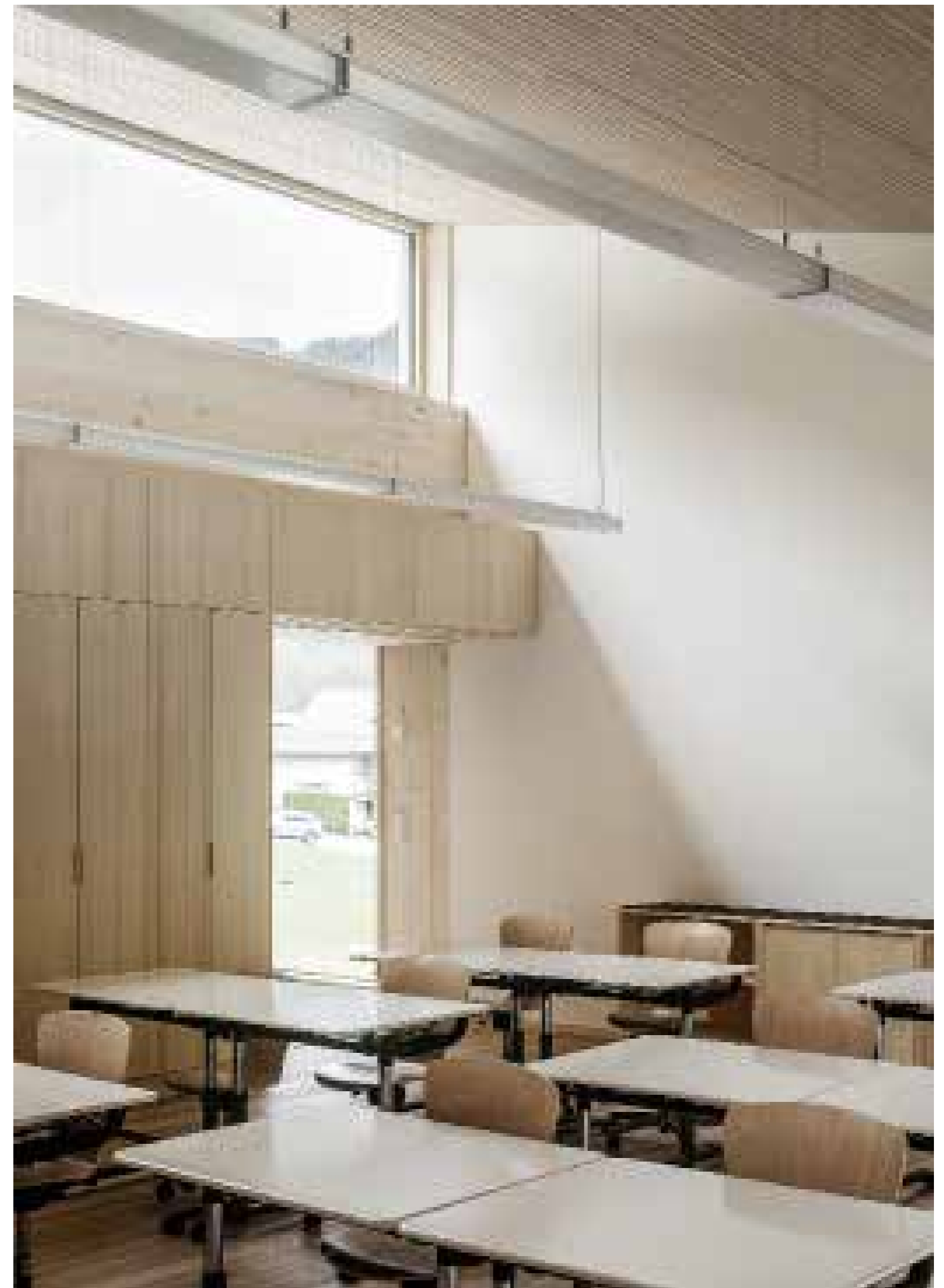
Ein Oberlicht sorgt für helle Schulzimmer, auch wenn die Sonne im Winter tief steht. | Thanks to skylights the classrooms are bright even in the winter.

The new building is located next to a Gothic church which was extended with an eye-catching wooden saddle roof in the 1960's. In keeping with the times but without forgetting tradition – a principle the new school also adheres to. The plain structure is situated on the old street that leads to the village square with the church. The log house façade combines solid planks, airy windows and aluminium brise-soleil. With its inclination, the mono-pitched roof is a reference to the old buildings surrounding the new school. The architects opted for a vertical room arrangement: semi-public spaces in the basement, kindergarten on the ground floor, school on the upper floor. The music room in the basement, where music students →