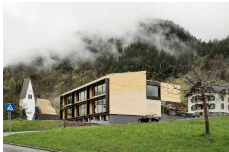
Der schlichte Holzbau steht an der alten Dorfstrasse. | The plain timber construction is situated on the old village street.

20 Volksschule und Kindergarten | Primary school and kindergarten, 2015 1. Preis | 1 st prize, € 25 000 Gufer 48, A-Brand Bauherrschaft | Principals: Gemeinde Brand Architektur | Architecture: ARGE Spagolla Zottele Mallin Architekten, A-Bludenz Bauphysik | Building physics: Bernhard Weithas, A-Lauterach Baukosten | Building costs: € 3,4 Mio. Energiekennzahl | Energy key: 10 kWh/m 2 a