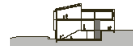
Querschnitt | Section